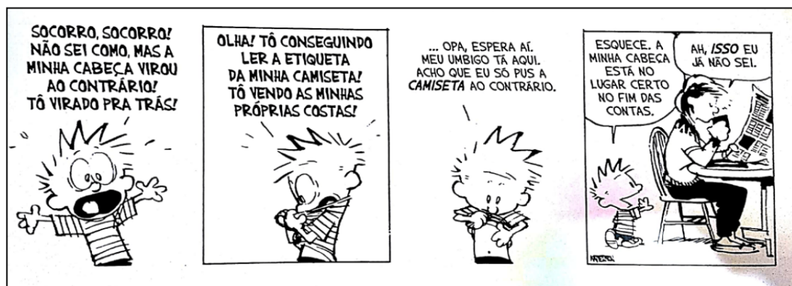
(In: WATTERSON, B. Os dias estão todos ocupados: as aventuras de Cavin e Haroldo. São Paulo: Conrad, 2011.)

Na fala da mãe de Calvin, no último quadro, ante toda a situação vivenciada por Calvin, bem como da relação entre as personagens, percebe-se a constituição de uma