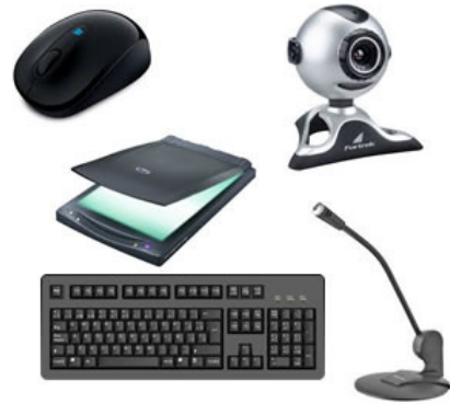
Periféricos de entrada.

- Periféricos de entrada: são aqueles que enviam informações para o computador. Ex.: teclado, mouse, scanner, microfone, etc.