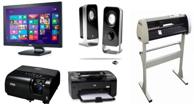
Periféricos de saída.

- Periféricos de saída: São aqueles que recebem informações do computador. Ex.: monitor, impressora, caixas de som.