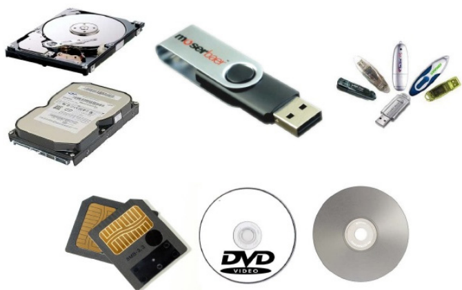
Periféricos de armazenamento.