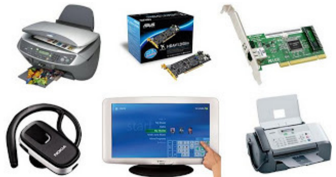
Periféricos de entrada e saída.

- Periféricos de entrada e saída: são aqueles que enviam e recebem informações para/do computador. Ex.: monitor touchscreen, drive de CD – DVD, HD externo, pen drive, impressora multifuncional, etc.