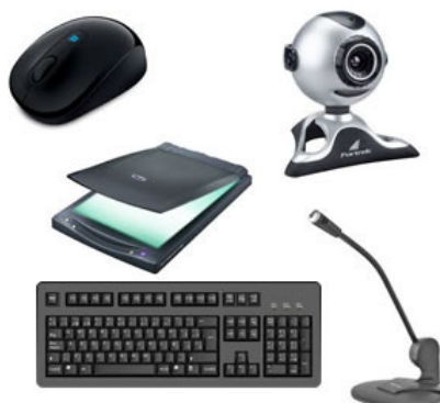
Periféricos de entrada.

- Periféricos de entrada: são aqueles que enviam informações para o computador. Ex.: teclado, mouse, scanner, microfone, etc.