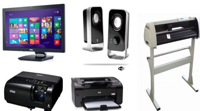
Periféricos de saída.

- Periféricos de saída: São aqueles que recebem informações do computador. Ex.: monitor, impressora, caixas de som.