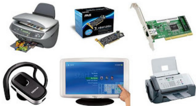
Periféricos de entrada e saída.

- Periféricos de entrada e saída: são aqueles que enviam e recebem informações para/do computador. Ex.: monitor touchscren, drive de CD – DVD, HD externo, pen drive, impressora multifuncional, etc.