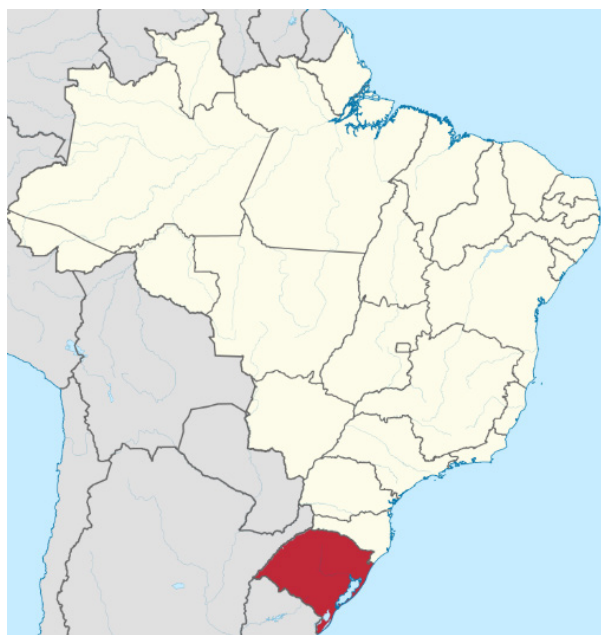
Rio Grande do Sul no mapa do Brasil