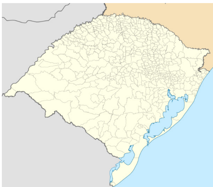
Rio Grande do Sul