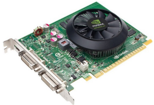
Placa de vídeo 7

Permitem que os resultados numéricos dos cálculos de um processador sejam traduzidos em imagens e gráficos para aparecer em um monitor.