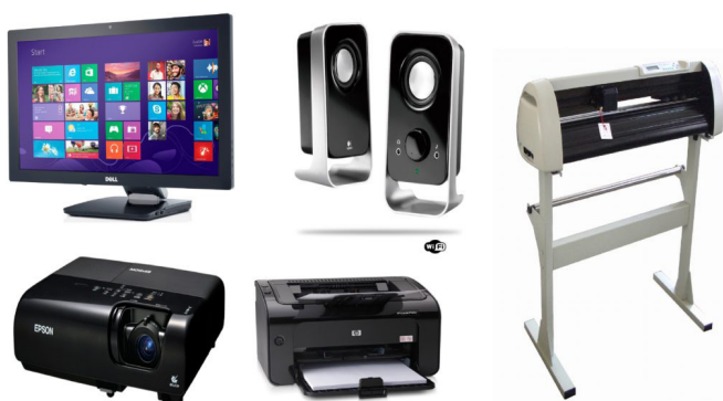
Periféricos de saída. 9

– Periféricos de saída: São aqueles que recebem informações do computador. Ex.: monitor, impressora, caixas de som.