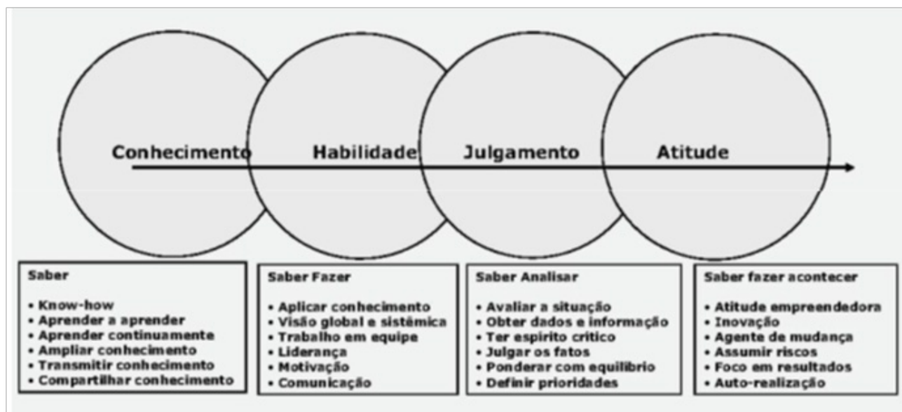
Figura – As competências essenciais do administrador, segundo Chiavenato

Assim, o administrador deve ocupar diversas posições estratégicas nas organizações e desenvolver papéis essenciais à sustentabilidade e crescimento dos negócios.