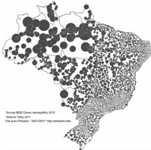
Figura 8: Exemplo de mapa temático.

“Cada mapa possui um objetivo específico, de acordo com os propósitos de sua elaboração, por isso, existem diferentes tipos de mapas. O mapa temático deve cumprir sua função, ou seja, dizer o quê, onde e, como ocorre determinado fenômeno geográfico, utilizando símbolos gráficos (signos) especialmente planejados para facilitar a compreensão de diferenças, semelhanças e possibilitar a visualização de correlações pelo usuário”. ARCHELA, R. S.; THÉRY, H. Orientação metodológica para construção e leitura de mapas temáticos. Confins , n. 3, 2008.