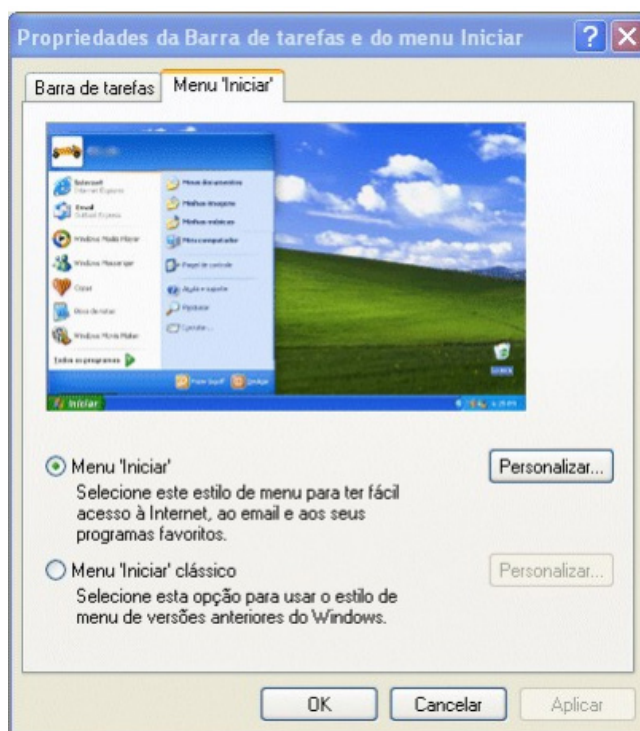
Propriedades de Barra de tarefas e do Menu Iniciar.