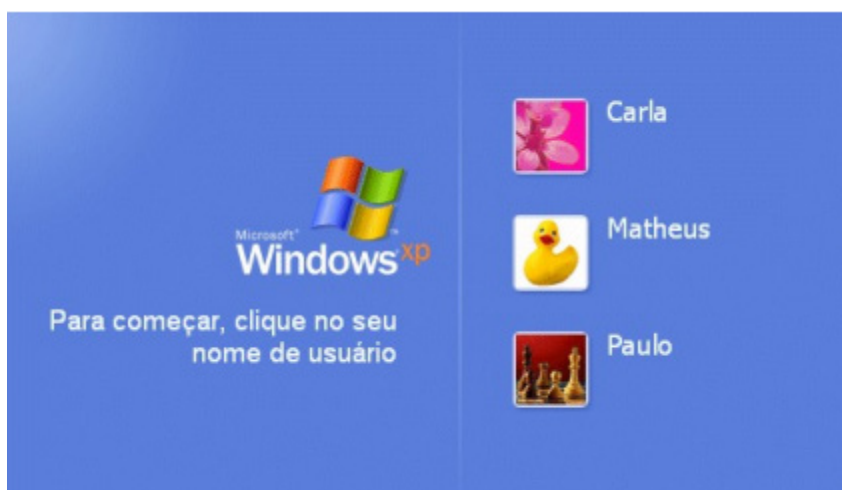
Tela de Logon.

Ao iniciar o Windows XP a primeira tela que temos é tela de logon, nela, selecionamos o usuário que irá utilizar o computador 1 .