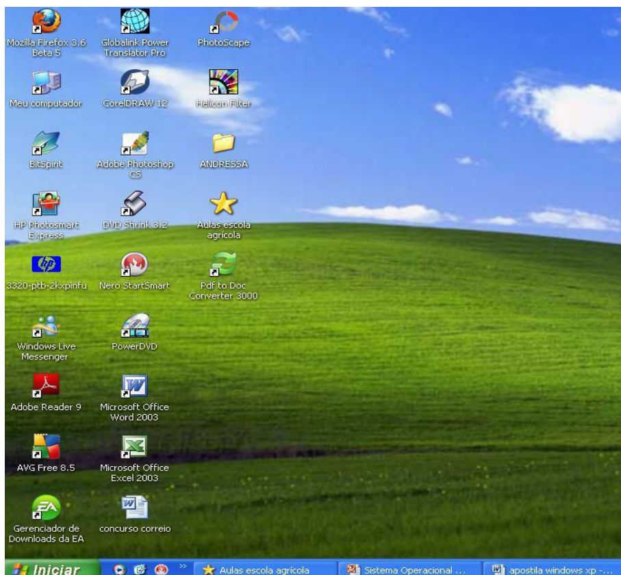
Área de trabalho do Windows XP.

Na Área de trabalho encontramos os seguintes itens: