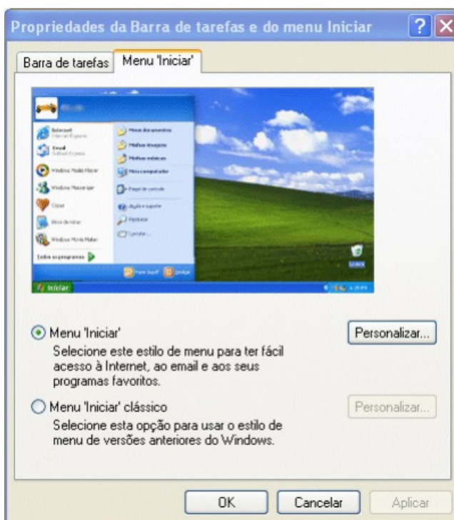
Propriedades de Barra de tarefas e do Menu Iniciar.