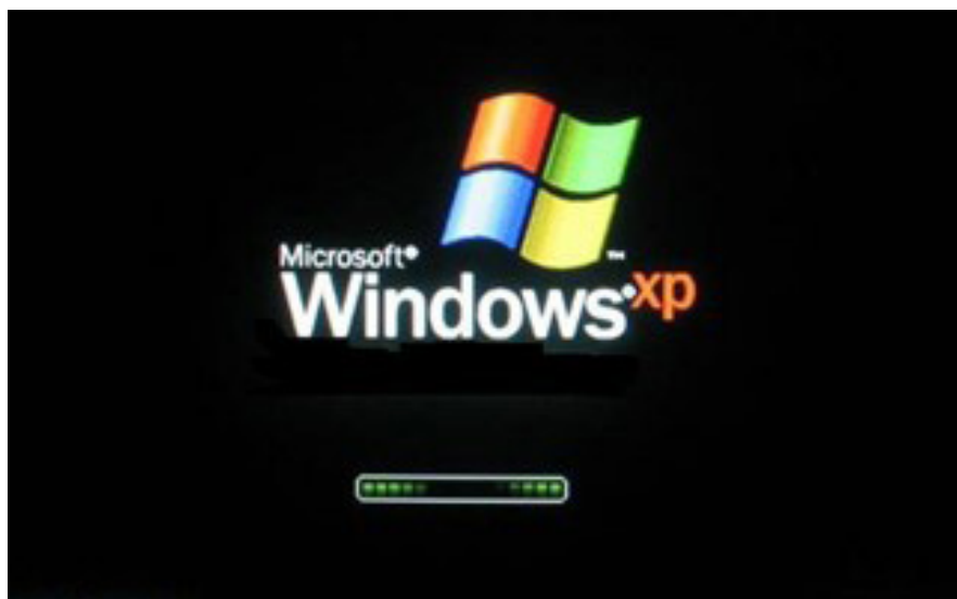
Inicialização do Windows XP.

O XP embute uma porção de acessórios muito úteis como: editor de textos, programas para desenho, programas de entretenimento (jogos, música e vídeos), acesso à internet e gerenciamento de arquivos.