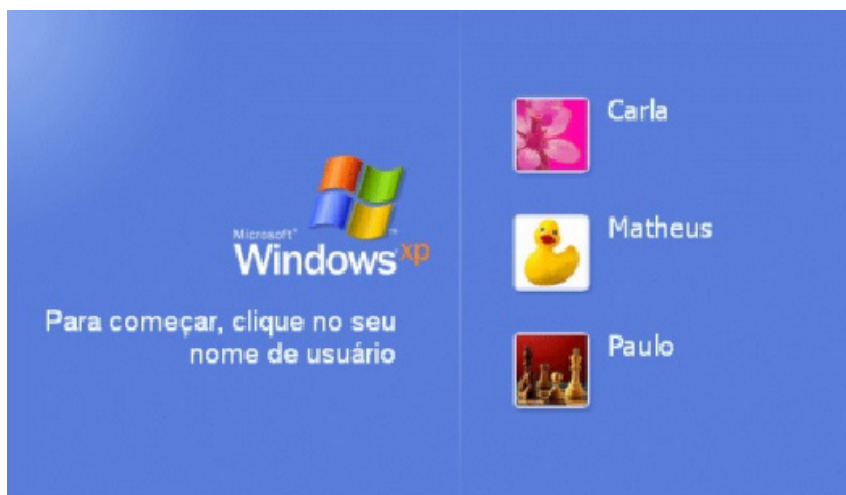
Tela de Logon.

Ao entrarmos com o nome do usuário, o Windows efetuará o Logon (entrada no sistema) e nos apresentará a área de trabalho