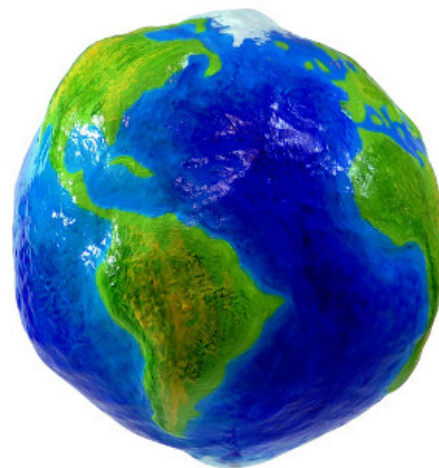
Modelo do formato geóide da Terra.

Os movimentos do planeta, como a rotação (em torno de si) e a translação (ao redor do Sol), possibilitaram uma forma esférica da Terra, que é achatada nos polos. Essa forma recebe o nome de geóide. Seu interior é algo inóspito, e, até pouco tempo atrás, desconhecido.