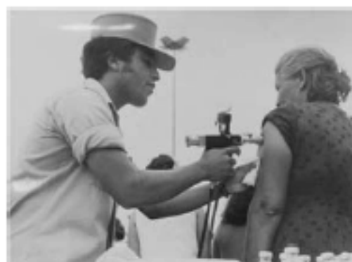
1975 – Campanha Nacional de Vacinação contra a meningite, em São Paulo