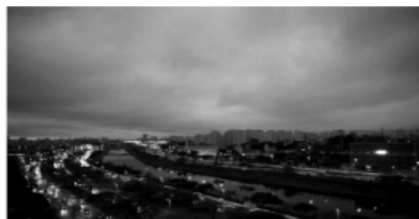
Marginal Tietê, 19/08/2019, às 16 horas.

Um fenômeno inusitado surpreendeu os paulistanos, na tarde de 19 de agosto de 2019. Mesmo com os relógios marcando 16 horas, o céu da capital paulista estava encoberto por nuvens e o “dia virou noite”.