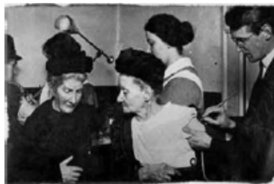
1908 - Epidemia de Varíola leva a população aos postos de vacinação, no Rio de Janeiro

As imagens a seguir retratam a história da consolidação do programa de vacinação brasileira ao longo de mais de 100 anos e testemunham a história da virologia e da luta dos cientistas para a erradicação de moléstias no Brasil.