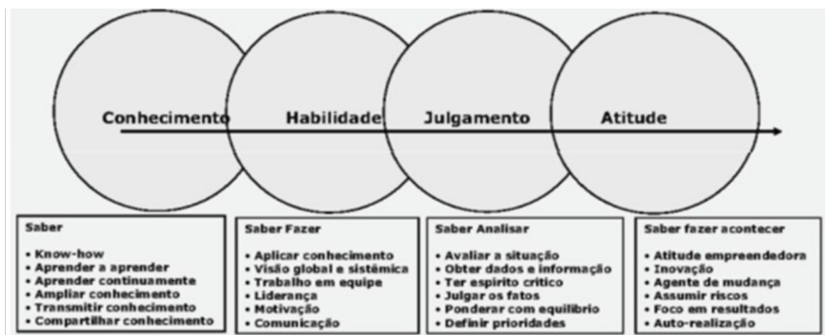
Figura – As competências essenciais do administrador, segundo Chiavenato

Assim, o administrador deve ocupar diversas posições estratégicas nas organizações e desenvolver papéis essenciais à sustentabilidade e crescimento dos negócios.