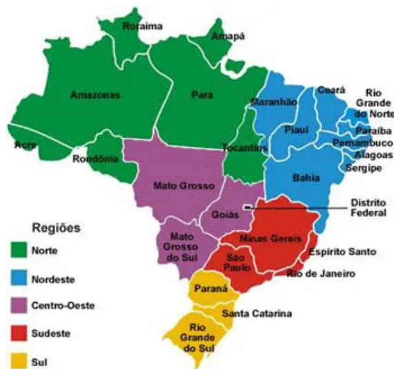
Mapa político que mostra as regiões do Brasil

• Mapa Político: representam as divisões territoriais (fronteiras) entre um espaço delimitado, como cidades, países, continentes, etc