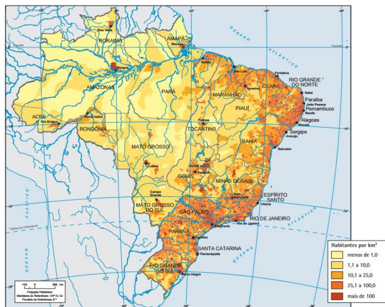
Mapa Demográfico do Brasil