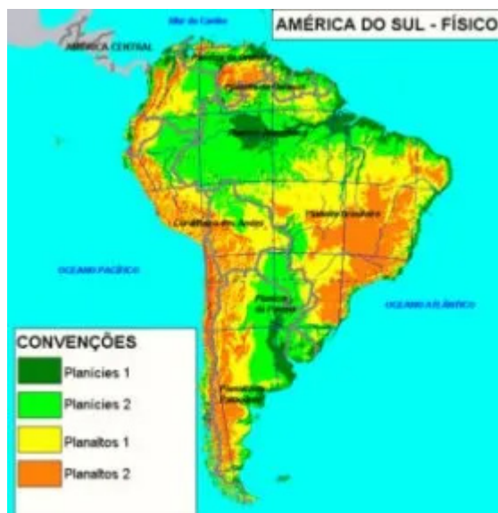
Mapa físico com informações sobre o relevo da América do Sul