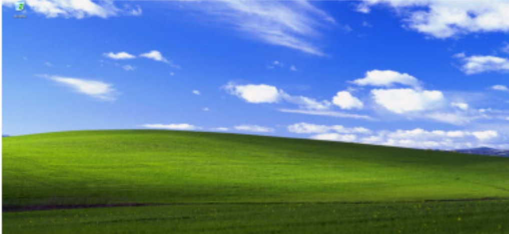
Área de trabalho do Windows XP

Local usado para armazenar itens que necessitem de acesso rápido, que são representados por ícones, no exemplo abaixo temos acesso apenas a lixeira, esta é configuração inicial do Windows XP. Quando instalamos novos programas no computador sempre é sugerida a criação de um atalho para o mesmo, que vai aparecer na área de trabalho, também é possível criar atalhos ou pastas. Não é recomendado que sejam criadas pastas na área de trabalho, pois quanto mais pastas e arquivos existirem na área de trabalho, mais lenta se tornara a inicialização de seu sistema operacional.