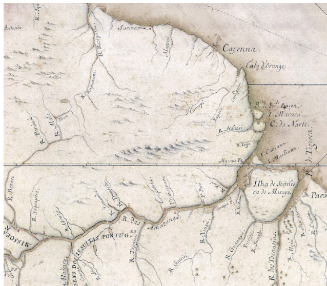
Este é um fragmento da Carta das Cortes, de 1749, mostrando-se a área do atual Estado do Amapá.

(1801), o rio Carapanatuba. Foram anulados pelo manifesto do príncipe regente (1808) e pelo artigo adicional n.º 3 ao Tratado de Paris (1814). O Tratado de Amiens (1802), celebrado por França, Espanha, Reino Unido e Países Baixos, reconheceu, igualmente, a fronteira no Araguari. Não teve, contudo, a adesão de Portugal.