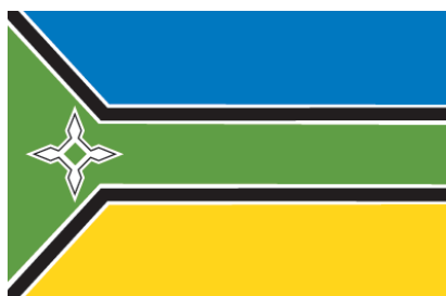
Bandeira do Estado do Amapá