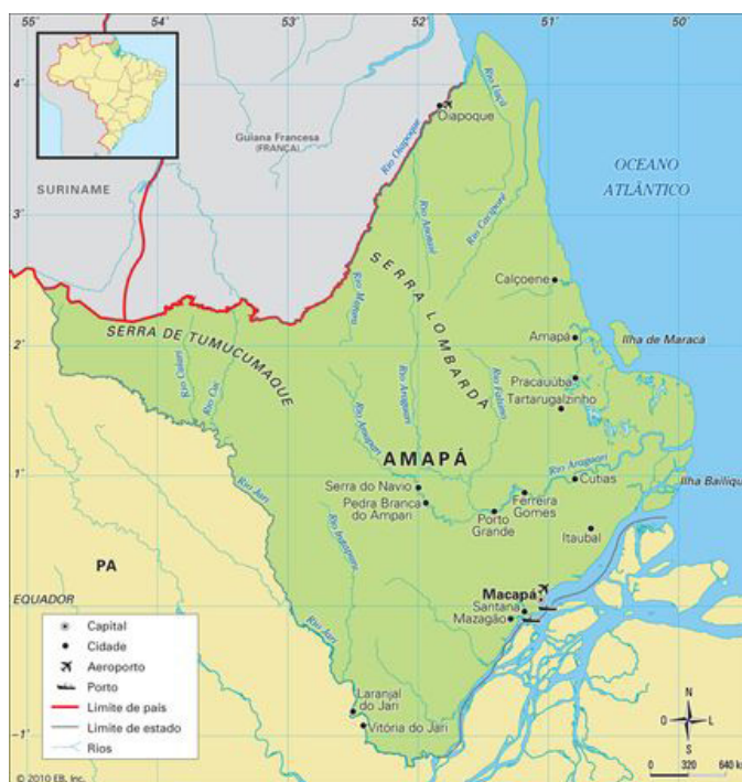
Mapa do Amapá