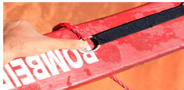
Figura 16 – Acondicionamento do flutuador, passo 1.

Para iniciar o serviço, o Guarda-Vidas deverá acondicionar corretamente o flutuador, deixando-o pronto para ser empregado. Com o polegar esquerdo, segurando a argola distal sobre o corpo do flutuador, deve-se enrolar o cabo em torno do corpo do flutuador (de 2 a 3 voltas). Ao final, deverá inserir o restante do cabo permeado no interior da argola, desenvolvendo até que alcance o mosquetão. O seio do cabo estará fixado ao mosquetão, formando, juntamente com o cinto, uma alça, o que facilitará seu transporte, conforme a figura, e seu desenrolar automático em caso de emergência.