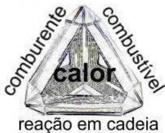
Figura 1- Tetraedro do Fogo

Passemos ao estudo de cada um dos três elementos da combustão e da reação em cadeia.