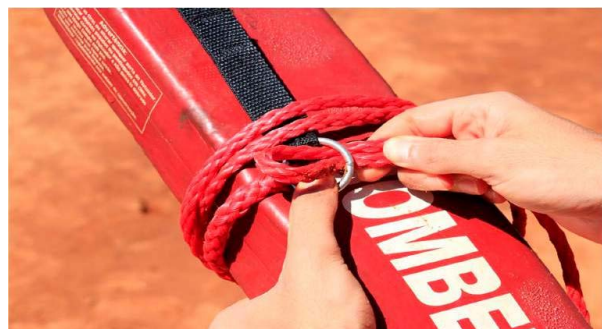
Figura 17 – Acondicionamento do flutuador, passo 2.