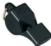
Figura 15 – Apito sem esfera.

Existem vários modelos de apitos disponíveis no mercado, porém recomendam-se apitos fabricados em PVC, ou material similar, que apresentem boa resistência, sobretudo no bocal. Devem oferecer um sibilo constante e forte (acima de 115 decibéis) e preferencialmente não possuir esferas em seu interior.