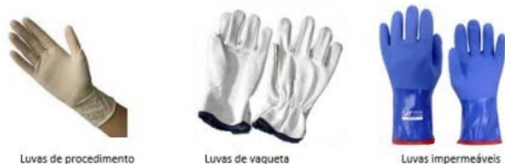
Figura 3.1 – Luvas de proteção

Para a segurança do socorrista, deve-se usar luvas de procedimento para o impedimento de contato com materiais contaminantes, luvas de vaqueta para proteção contra superfícies abrasivas e/ou materiais perfuro-cortantes, e em alguns casos, luvas com um nível de impermeabilização mais elevado para a proteção contra águas poluídas, produtos perigosos, etc.